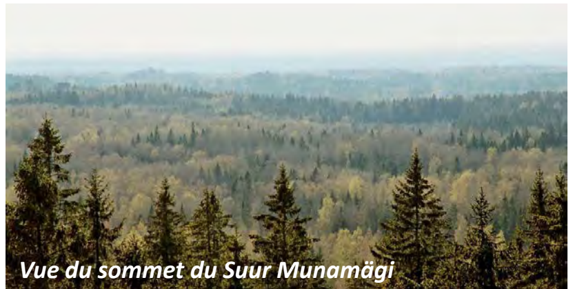
Vue du sommet du Suur Munamägi