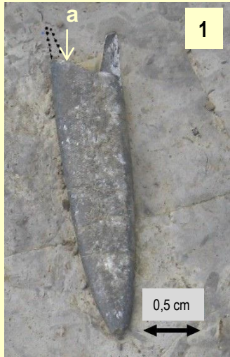
1 : Rostre de Bélemnite avec la zone (a) d'insertion de la partie constituée de loges alvéolées (1) (coupe du Belchou)