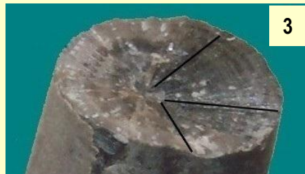
3 : structure en cristaux calcitiques radiés du rostre