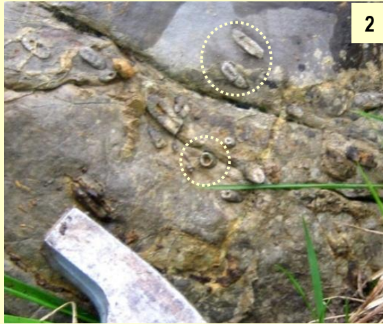
2 : Niveau à Bélemnites (coupe du Belchou)