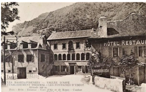
Les Fontaines d'Escot

En Aspe, les thermes de Fontaines d'Escot bien sûr, mais aussi d'autres lieux moins connus ou oubliés comme les bains de Suberlaché, de Chichit, de Bulasquet et de Labérouat.