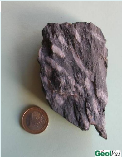
Polypier ramifié du Dévonien (de -400 à -360 Ma) - Col du Somport