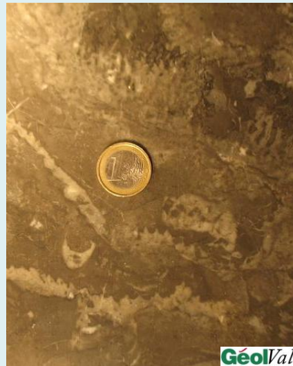
Polypier en plaques encroûtantes du Crétacé (de -130 à -65 Ma) - Arudy